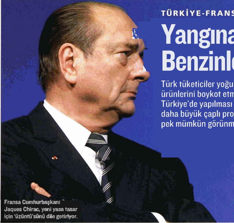
Fransa Cumhurbaşkanı Jacques Chirac, yeni yasa tasar için 'üzüntü'sünü dile getiriyor.